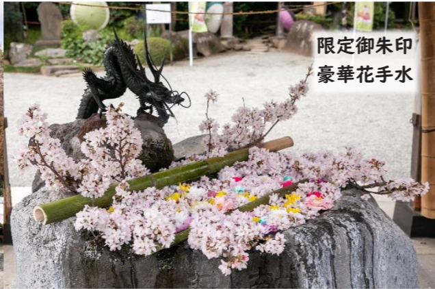
限定御朱印 豪華花手水