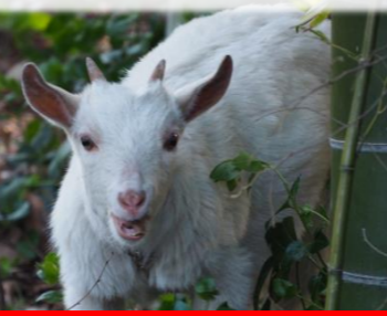
ヤギのモモも待ってるよ♪